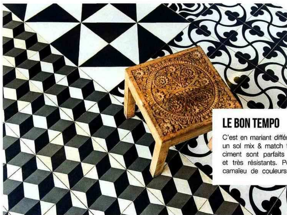
Mosaic Del Sur