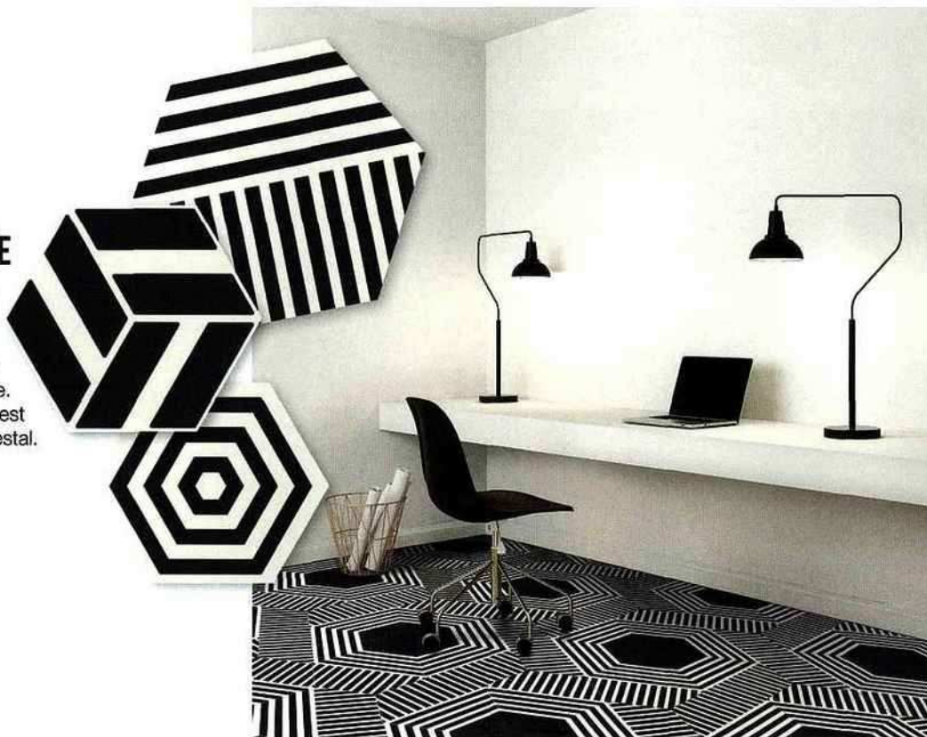
Core Basics d'Ornamenta au Showroom David B

L'illusion d'optique ou l'art de jouer avec les hexagones... Ces carreaux de porcelaine peints réinterprètent les traditionnels carreaux de ciment marocains en version contemporaine. Le sol se fait déco et le mobilier est sublimé, comme posé sur un piédestal.