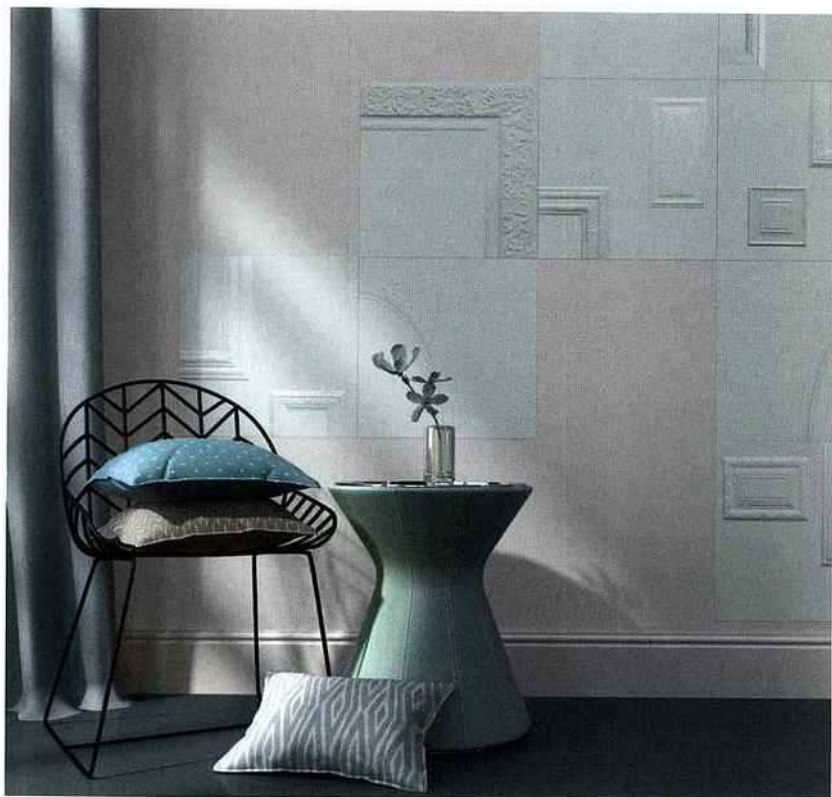
Frames d'Ornamenta au show-room David B